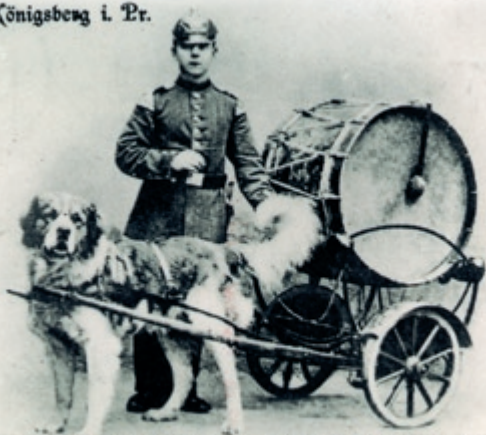
Grosser Trommelwagen und Hund der Kapelle des Inf.-Regt. Herzog Karl von Mecklenburg-Strelitz (6. Ostpr.) No. 43

Das Musikkorps des Infanterie-Regiments Herzog Karl von Mecklenburg-Strelitz (6. Ostpreuß.) Nr. 43 galt in Königsberg nicht nur als Spitzenmusikkorps, es führte auch einen traditionsgebundenen Sonderstatus.