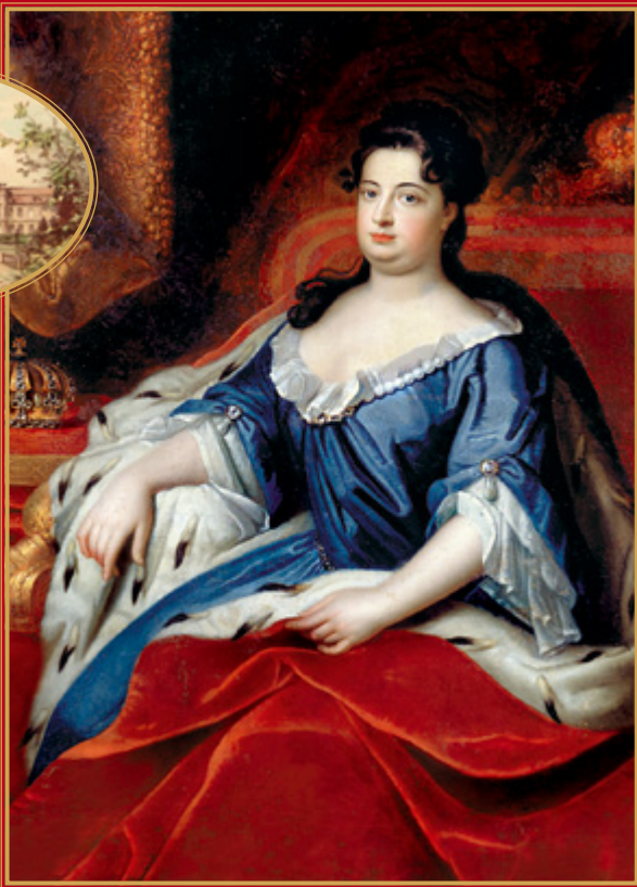
Königin Sophie Charlotte (1668–1705)